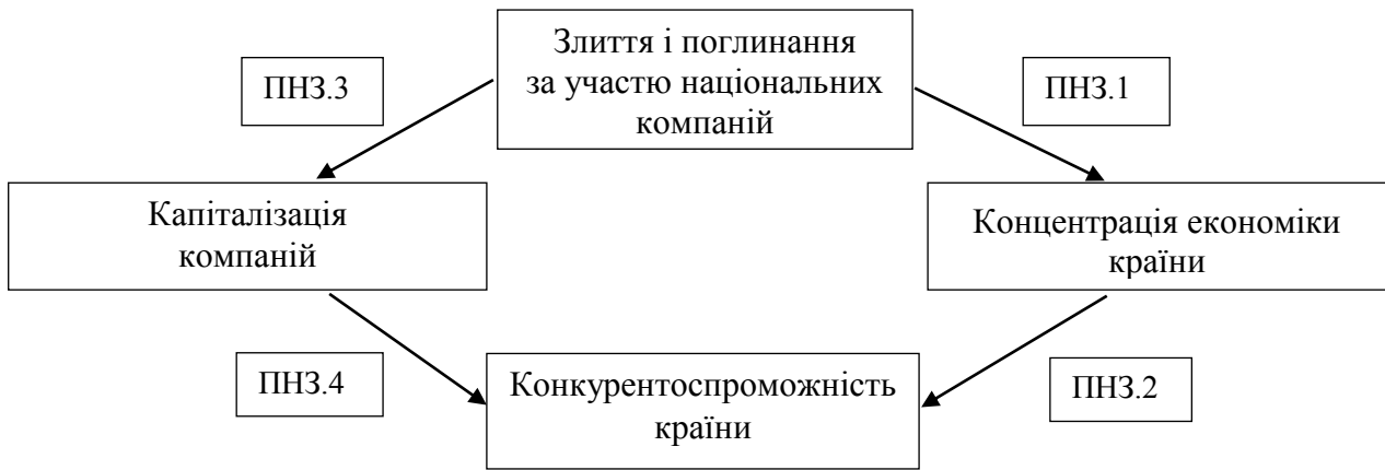
Рис. 1. Логіко-аналітична схема взаємозалежності процесів, що визначають конкурентоспроможність країни:

ПНЗ.1 – щодо впливу процесів ЗіП за участю національних компаній на концентрацію економіки країни; ПНЗ.2 – щодо впливу концентрації в економіці країни на її конкурентоспроможність; ПНЗ.3 – щодо впливу інтенсивності процесів ЗіП за участю національних компаній на їх капіталізацію; ПНЗ.4 – щодо впливу капіталізації національних компаній на конкурентоспроможність країни