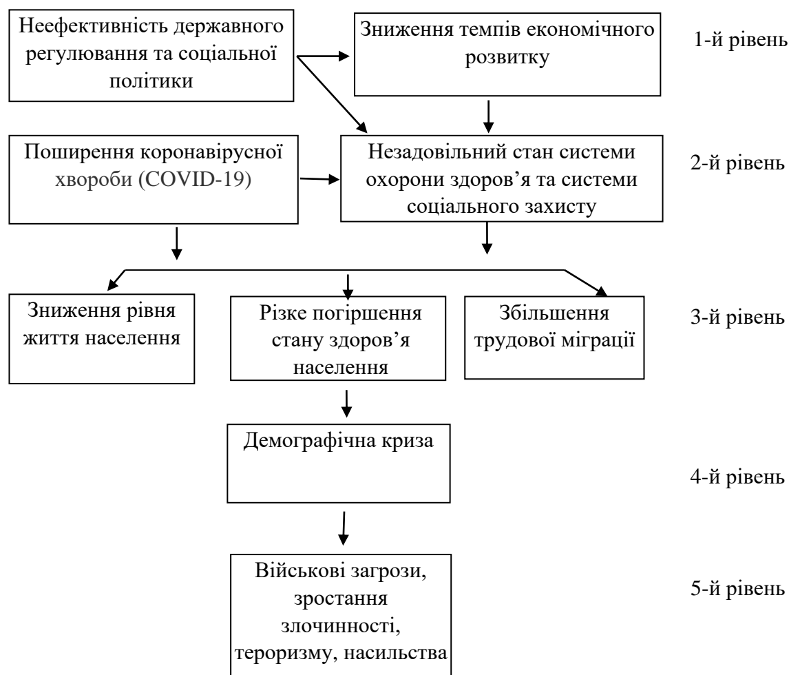
Рис. 2. Ієрархічно структурований граф загроз соціальній безпеці України

У результаті проведеного дослідження визначено, що соціальна сфера є ключовою детермінантою макроекономічної стабільності країни. Із використанням міжнародних індексів і рейтингів здійснено діагностування проблем забезпечення макроекономічної стабільності та соціальної безпеки України порівняно з країнами ЄС. Виявлено проблеми забезпечення соціальної безпеки України порівняно з країнами ЄС: депопуляція та старіння населення; низька тривалість життя; низький рівень доходу населення; незадовільна якість системи охорони здоров'я.