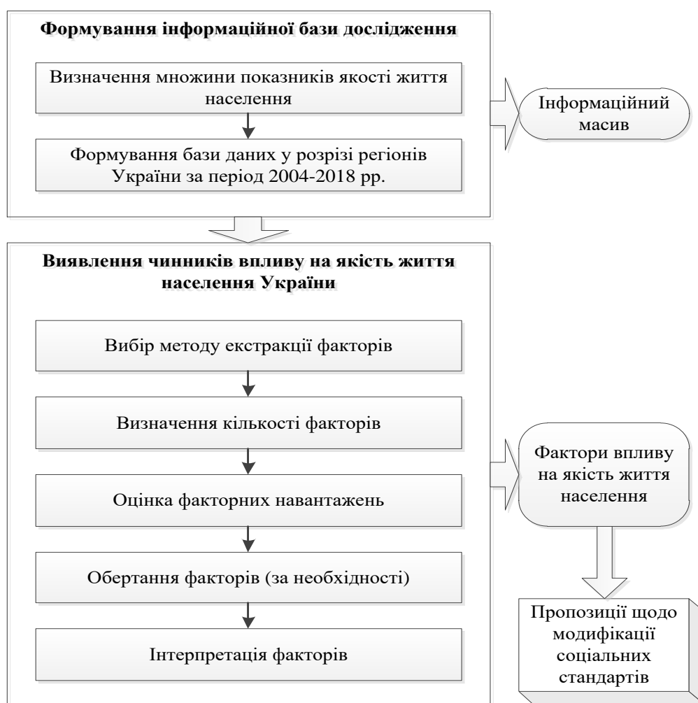
Рис. 4. Методичний підхід до оцінки факторів впливу на якість життя населення України

Розроблено методичний підхід до оцінки факторів впливу на якість життя населення України (рис. 4).