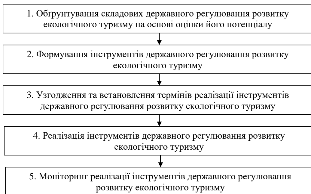
Рис. 2. Організаційне забезпечення державного регулювання розвитку екологічного туризму в Україні

З метою впровадження державної політики, спрямованої на покращення рівня розвитку екологічного туризму у країні, доцільно визначити організаційне забезпечення державного регулювання розвитку екологічного туризму у країні.