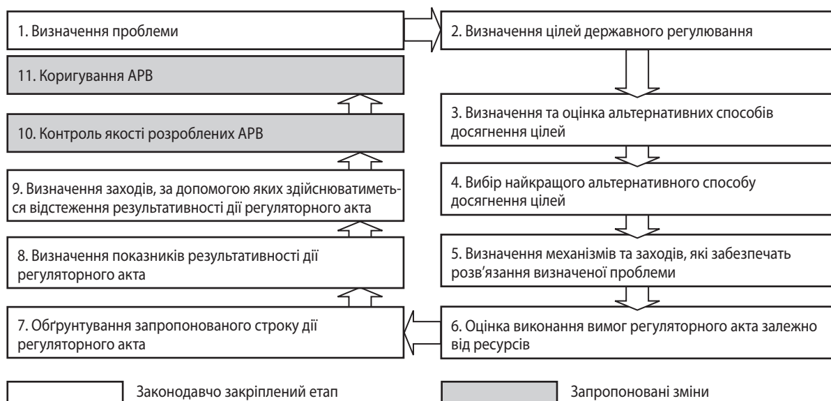
Рис. 3. Доповнена процедура проведення аналізу регуляторного впливу