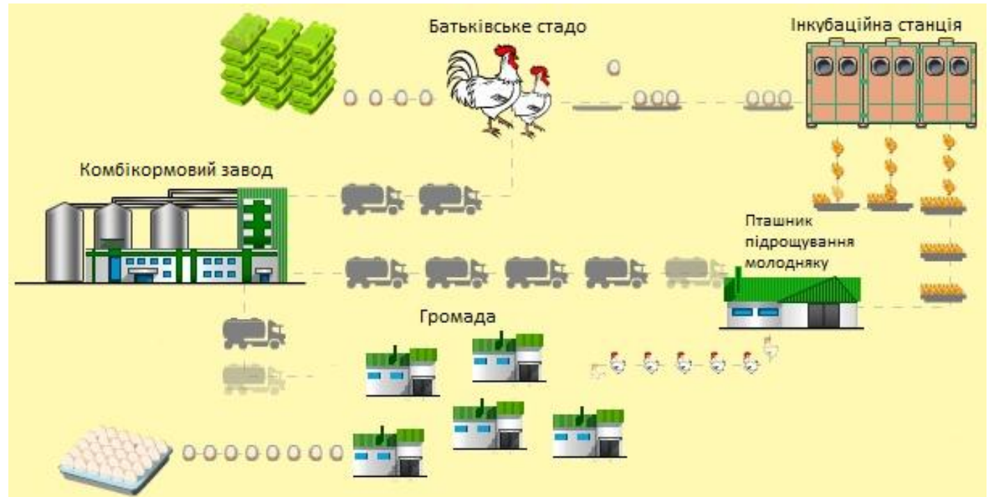
Схема організації проекту:

Мета проекту - забезпечення самодостатності об'єднаної територіальної громади у продуктах птахівництва та створення умов для самозабезпеченості населення у цій галузі.