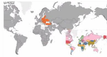
Кластеризація країн світу на даних 2016-2020 рр.

* https://nfmte.kneu.ua/archive/2023/12.03