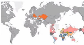
Кластеризація країн світу на даних 1991-1995 рр.