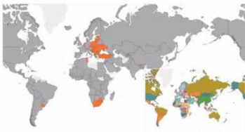
Кластеризація країн світу на даних 2006-2010 рр.