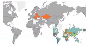
Кластеризація країн світу на даних 2001-2005 рр.