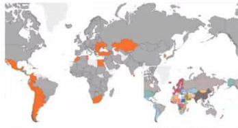
Кластеризація країн світу на даних 1996-2000 рр.