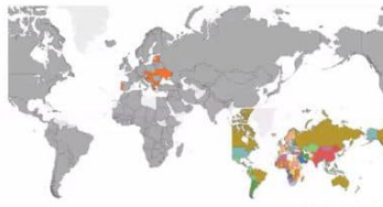
Кластеризація країн світу на даних 2011-2015 рр.