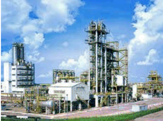
Рис. 1. Завод синтетичного моторного палива

Характерною сучасною рисою світової сфери енергокористування є стійка тенденція зростання виробництва та використання нетрадиційних видів палива та енергії. Основним фактором виникнення даної тенденції є прагнення енергетично дефіцитних країн до задоволення своїх потреб за рахунок інтенсифікації використання власного паливно-енергетичного потенціалу, з метою послаблення зовнішньої енергетичної залежності. У рамках даної тенденції найбільш активного розвитку набуло виробництво синтетичних аналогів моторного палива з ненафтової сировини (вугілля, природного газу та інших вуглевмісних речовин).