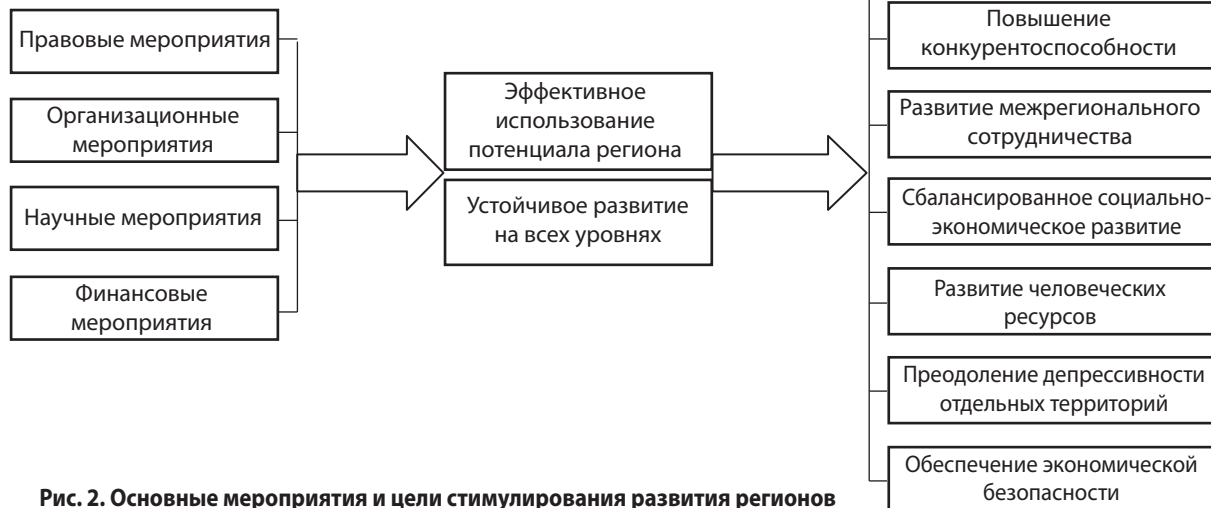
Рис. 2. Основные мероприятия и цели стимулирования развития регионов

Проведенный анализ основных нормативно-правовых документов, которые регламентируют порядок разработки стратегий и планов социально-экономического развития Украины и её регионов, позволил сделать вывод о том, что в них отсутствуют документы, связанные с обеспечением экономической безопасности страны и ее регионов [5, 6, 8 – 17].