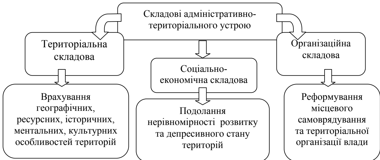
Рис. 1. Складові адміністративно-територіального устрою

Слід наголосити на виокремленні певних складових адміністративно-територіального устрою, доцільність якого обумовлена сучасними реаліями соціально-економічного розвитку, що полягають у наявності значних диспропорцій розвитку між окремими адміністративно-територіальними одиницями та ознак депресивного стану певних територій. Таким чином, адміністративно-територіальний устрій потребує визначення підходів до аналізу з урахуванням трьох складових – територіальної, соціально-економічної та організаційної. Інакше кажучи, вимоги до поділу держави на окремі адміністративно-територіальні одиниці треба визначати з урахуванням особливостей територій (географічних, культурних, історичних та ін.); досягнення рівномірного соціально-економічного розвитку та зменшення ознак депресивного стану територій; необхідності раціонального розподілу повноважень між органами місцевого самоврядування та місцевими органами виконавчої влади (рис. 1).