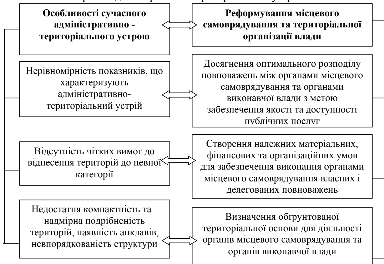
Рис. 2. Схема взаємозв'язків між особливостями сучасного адміністративно-територіального устрою й напрямками реформування місцевого самоврядування та територіальної організації влади

на створення стабільної системи управління на регіональному та місцевому рівнях відповідно до вимог ЄС з акцентом на збільшення повноважень місцевих органів самоврядування. Аналіз процесу здійснення реформ продемонстрував принципову неможливість та недоцільність здійснення суто територіальних перетворень без попередньої трансформації територіальної організації публічної влади у країні. Щодо застосування номенклатури територіальних одиниць для статистики у європейських країнах слід наголосити, що воно відбувалося у переважній більшості після проведення реформи адміністративно-територіального устрою та було спрямовано на збільшення повноважень базового рівня адміністративно-територіального устрою.