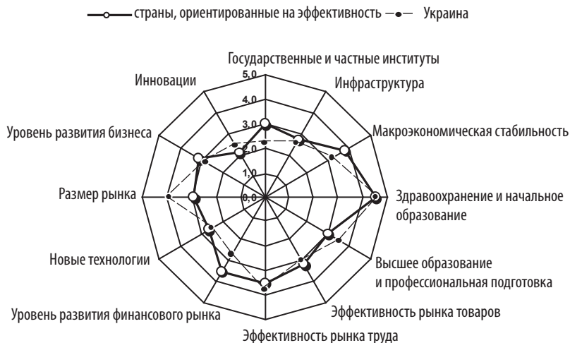
Рис. 2. Компоненты конкурентоспособности Украины в сравнении с другими странами, ориентированными на эффективность

объективной оценки последствий кризиса для экономики. Полученный рейтинг позволяет проанализировать причины, по которым страны выигрывают или проигрывают конкурентную борьбу.