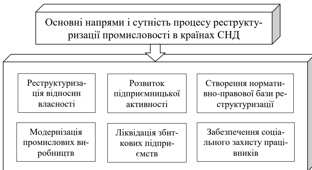
Рисунок 1.1 – Основні напрями забезпечення реструктуризації промисловості в країнах СНД у 90-х роках ХХ ст.

Реструктуризацію промисловості в країнах СНД, яка була орієнтована на подолання економічного спаду і докорінне підвищення економічної ефективності та конкурентоспроможності національного виробництва, передбачалось здійснювати за кількома напрямками (рис.1).