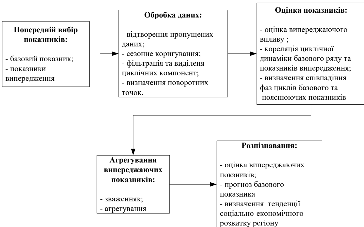
Рис. 2. Етапи створення системи розпізнавання тенденцій соціально-економічного стану регіонів на основі випереджаючих індикаторів

Процес розпізнавання негативних тенденцій на основі використання зведених індексів відбувається згідно схеми, показаної на рис. 2. На першому етапі було здійснено вибір базового показника, який є головним індикатором економічного розвитку. Як базовий мав би бути обраний показник індекс реального ВРП, але періодичність його обрахунку раз на рік унеможливило його використання для оперативної оцінки. Аналіз наукової літератури, та методичних підходів до оцінки рівня економічного розвитку регіонів, та кореляційний аналіз показав, що як базовий для усіх регіонів доцільно обрати індекс промислового виробництва, решта показників темпів розвитку розглядається як потенційні показники випередження.